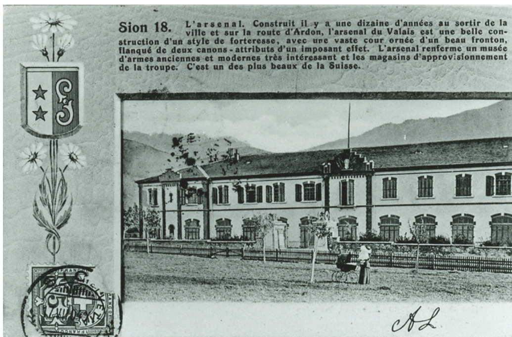
Arsenal cantonal, autour de 1904