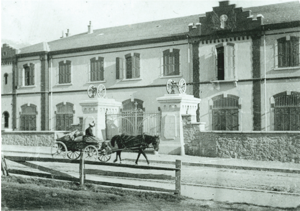
Arsenal cantonal, début XXème siècle