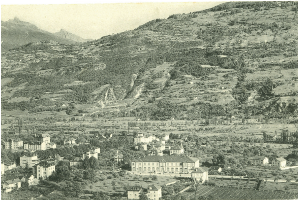
Vue sur l'arsenal cantonal et le versant sud de la Vallée du Rhône avec les Pointes de Tsavolire et La Maya en arrière-plan, autour de 1900-1920